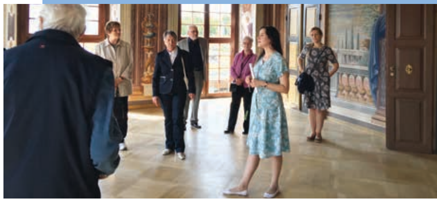
Besichtigung Galeriegebäude in Hannover-Herrenhausen