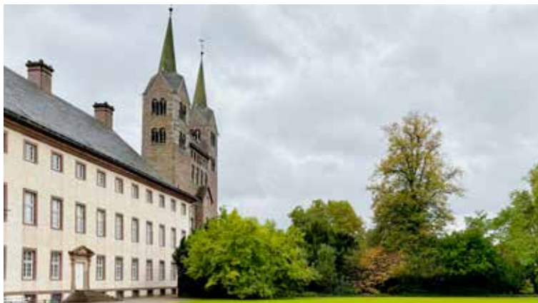
Das Weltkulturerbe Corvey an der Weser mit den Türmen seines Westwerks aus dem 9. Jahrhundert